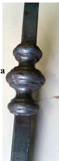
Paletto 12x12 h1000 Con borchia elettrosaldata