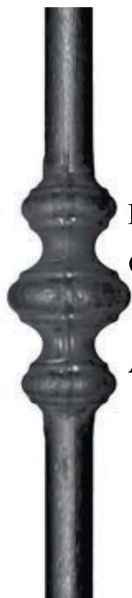
Paletto tondo 12 h1000 Con borchia elettrosaldata

TUTTI GLI ARTICOLI DI QUESTA PAGINA POSSONO ESSERE REALIZZATI A MISURA