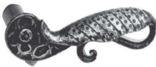
70x135 (coppia) 169/11