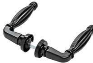
MANIGLIA ALL. COM213