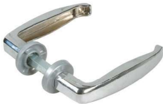
MANIGLIA CROMATA VIGBTC8