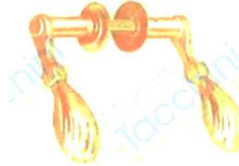
MANIGLIA OTTONATA VIG5054990