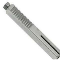
Q8x65 A ESPANSIONE VIG30500206