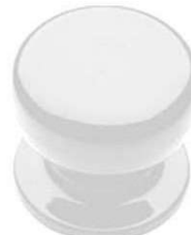
POMOLO FISSO PIPPO D70 BIANCO VIG505888B