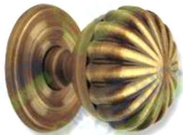
FISSO POMOLO MARGHERITA VIG290755500