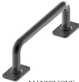
MANIGLIONE I=216 H=60 FACVB1225.14