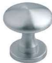
D43 CROMO SAT. POMOLO GEMINI VIG447320