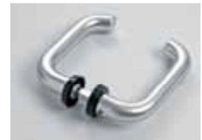
MANIGLIA ALLUMINIO COM209 NERA COM209 GRIGIA