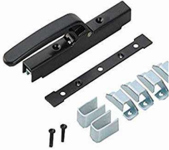
CARIGLIONE ASTE ESTERNE Q10 BI385