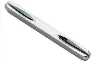
Q8x120 ALLUNGATO VIG30412070