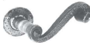
70x135 (coppia) 169/15