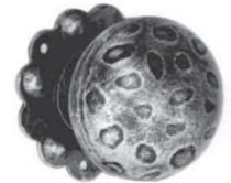
Ø60 Fisso 169/2 Ø60 Girevole 169/1