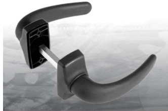
MANIGLIA NYLON BI358