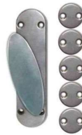
NICHELATA CREMONESE BRI171N