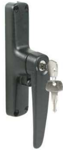
CREMONESE CON CHIAVE DESTRA O SINISTRA ASTE INTERNE BRI565/ZA ASTE ESTERNE BRI565/ZB