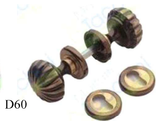
GIREVOLE POMOLO OTT BRUNITO OPACO VIG29075100