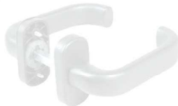
MANIGLIA C/MOLLA NERA BRI536/N BIANCA BRI536/B