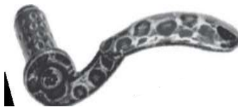
70x135 (coppia) 169/14