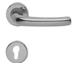
MILENA Q8 CROM SATIN VIG4425503