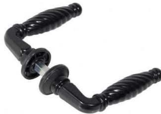
MANIGLIA ALLU. NERA VIG525435TX