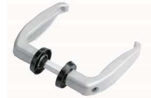
L25-35 L40-50 MANIGLIA NYLON GRIGIA COM210 GRIGIA