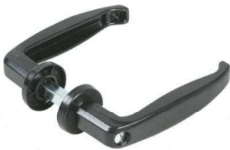
MANIGLIA NYLON NERA L25-35 BI355 L40-50