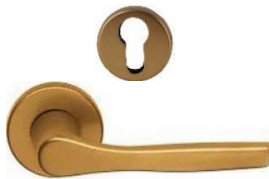
GABRY Q8 L80 VIG5057740