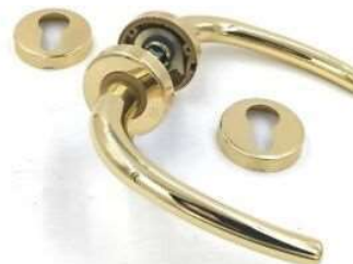
MILENA Q8 OTT LUCIDO VIG44281501