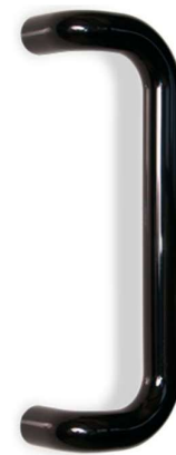
MPM82.01.401-N INTER. FORI =350 SPORGENZA= 87 LUNGHEZZA=350