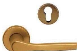
GABRY Q8 L120 VIG280004