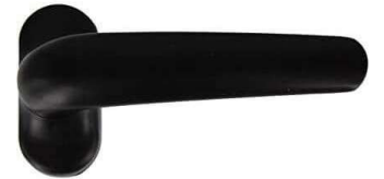
MEZZA MANIGLIA BIANCA TELEFO22260 NERA TELEFO22270