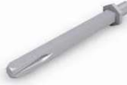
Q8 M10 L110 NIPLEX C/FOLLE VIG33600270