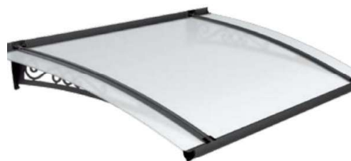
OLDSTYLE mod OS-01