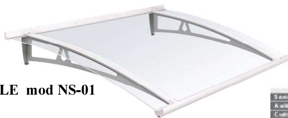
NEWSTYLE mod NS-01